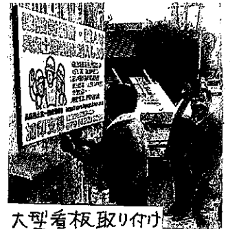
大型看板取り付け