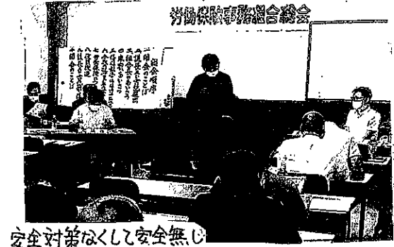
安全対策なくして安全無し

過去5年間の労働災害の型別でも、墜落・転落が最も多く、工事の種類では高所作業がある建設工事業でした。